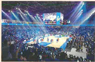
新アリーナの内部のイメージ

また民間による運営が想定されており、採算のためとして土日祝日の半分以上はプロの試合やコンサートで占められ、市民が自らのスポーツで使う機会は限られます。党市議団は、市民が気軽に使えるスポーツ環境の充実を求めます。