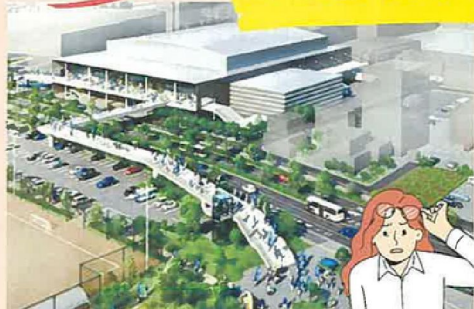
新アリーナとペDESTリアンデッキ(手前側)のイメージ