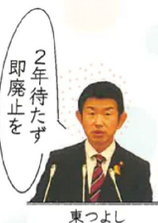
2年待たず 即廃止を