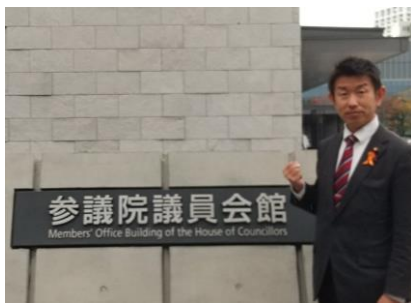
国への要請行動(11/21) 来年度予算編成へ、 国、県、市に声を届けます

市はWEBアンケートを12月31日まで集めていきます。アリーナ整備が前提で多額の税金が投入されることを載せないアンケートですが、中間報告では「どちら