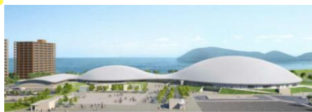
香川のアリーナ完成予想図

ひとつこと 香川県で建設中のアリーナを視察しました。使用不能になった県立体育館の建て替えですが、駅近く敷地も広いです。岡山市は145億円以上かかるアリーナ建設で「都市間競争」と言いますが、一人負けで税金のムダになりかねません。アリーナ建設に税金投入は反対です。(東つよし)