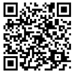
市の水道料金値上げ案