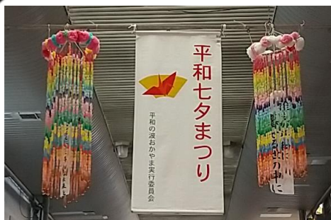
「平和七夕まつり」は7月20日まで

6月29日は岡山空襲から75年目の日。市主催の追悼式は、今年は新型コロナウイルスの影響で規模を縮小していとなまれました。若者を中