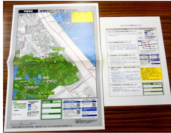
ハザードマップの本体

岡山市は一昨年の7月豪雨をうけて改定した「洪水・土砂災害ハザードマップ」を配りました。大雨で川の堤防が決壊した場合(外水被害)の水の深さと、開設する避難所や避難場所の地図です。小学校区ごとに記したものを市内全戸に郵送しています。