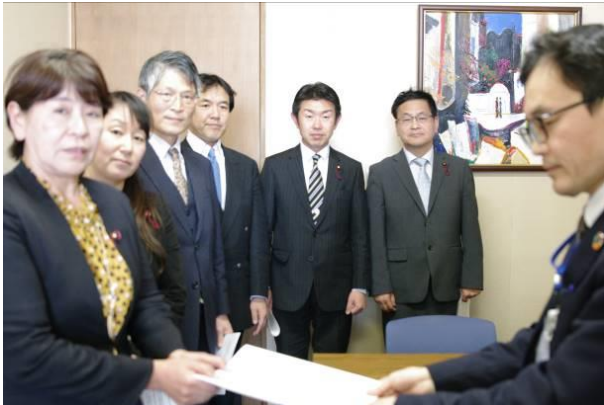
要望書は市長公室長に渡しました

料等の減免▼国保加入者への傷病手当創設▼国保証を取り上げられた人へ国保短期証の交付▼学校の夏休み頃までの見通しの公表▼市や、市の仕事を委託されている非正規職員の給料の保障▼固定費の補助など中小企業支援などを求めました。 倒産や解雇、内定取り消しなどが深刻です。声を党市議団にお寄せください。