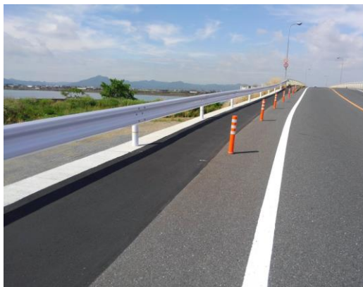
道路の色の濃い部分が拡幅された部分