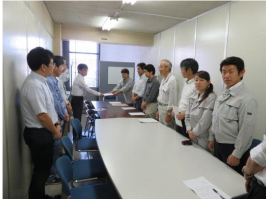
市当局への申し入れ(7/9)

年になります。で採択されて一禁止条約が国連ました。核兵器の指揮者を務める区を通るコースを迎えました。東市議は南