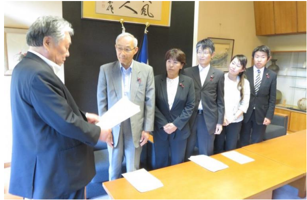
議長に申し入れる共産党市議団(5/19)

日本共産党市議団は申し合わせを守るべきと5月18日夜、議長不信任案を提出。賛成30、反対11、無効2で可決されました。議長不信任決議は実に47年