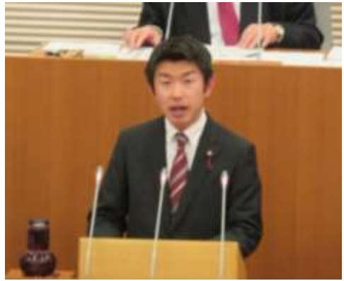
2月議会質問に立つ東市議(3/6)

東市議は3月6日、学童保育(放課後児童クラブ)について質問しました。学童保育は、保護者が働いているなどの小学生を放課後に見る「放課後のうち」です。運営は地域の人たちが担っています。現状は各クラブで開所日や時間がバラバラなので、市